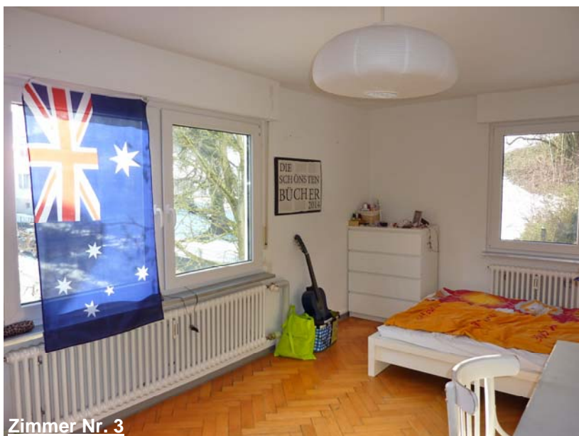
Zimmer Nr. 3